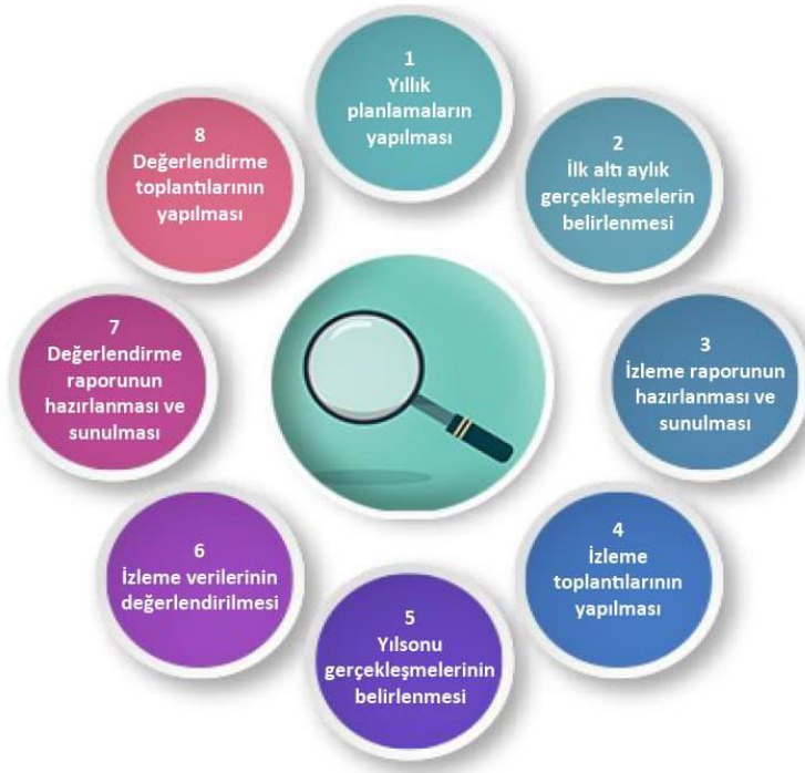
Şekil-4 İzleme ve Değerlendirme Süreci

İzleme ve değerlendirme sürecinin işleyişi ana hatları ile yukarıdaki şekilde özetlenmiştir.