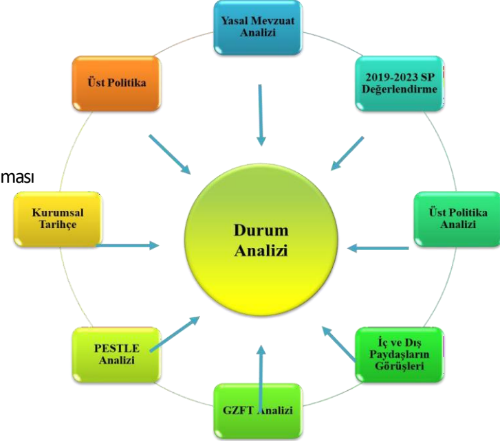
Şekil-1 Durum Analizi